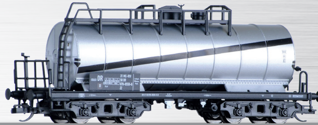
Art.-Nr.: 502103 Kesselwagen ZZ der DR, Ep. IV